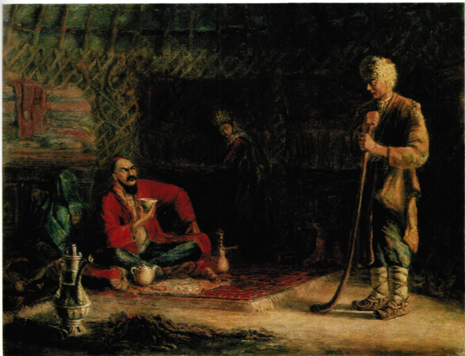
1 Бай и батрак. 1941